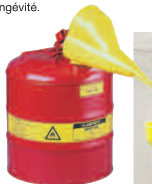
10801 & 11202Y

Afin d'aider au versement dans des ouvertures de petite taille, cet entonnoir novateur à deux positions s'attache facilement aux bidons de sécurité en acier de type I d'une capacité de 4 litres ou plus. La grande coupe arrondie protège contre les éclaboussures et les renversements. Le polypropylène durable résiste aux utilisations intensives.