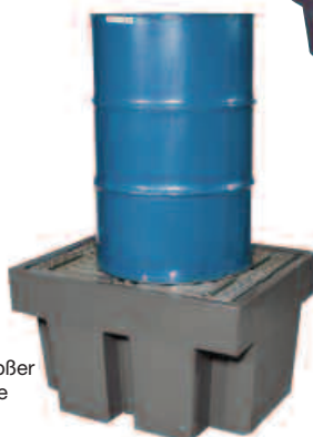
EU28214 mit großer Auffangwanne