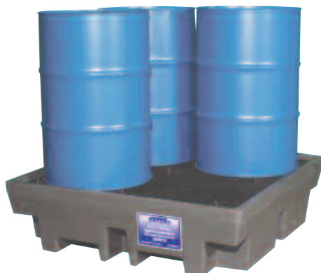
EU28274 mit großer Auffangwanne