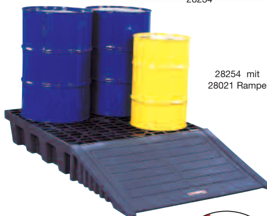
28254 mit 28021 Rampe